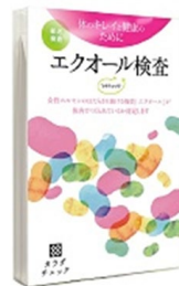
シミックリノベーションズ株式会社

肌の不調改善や更年期症状の改善等に働くエクオールが腸内でどのくらいつくれているかを調べる検査