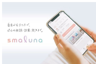
株式会社ネクイノ